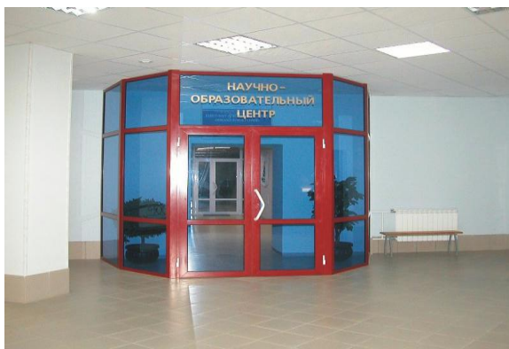
Вход в Центр

нефтегазового дела. Обучение в Центре проводится на основе магистерских программ шотландского университета Heriot-Watt (Шотландия, г. Эдинбург). Центр осуществляет подготовку специалистов по трем направлениям: Нефтяной инженеринг (MSc in Petroleum Engineering), Геология нефти и газа (MSc in Reservoir Evaluation) и Технология нефти и газа (MSc in Oil and Gas Technology). Обучение в Центре проходит в течение 12 месяцев и дает слушателям интегрированные знания и навыки командной работы, что является необходимым условием для успешной карьеры в современной нефтегазовой промышленности.