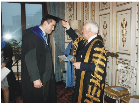
Вручение дипломов магистрам в Британском посольстве

Данная исследовательская работа является эквивалентом магистерской диссертации. Центр имеет современное техническое оснащение – более 150 персональных компьютеров, 5 рабочих станций SUN и единственный в Сибири зал 3D-визуализации. Данный зал используется в учебном процессе и позволяет наглядно продемонстрировать модель месторождения в трехмерном пространстве. Для практической работы Центр располагает грантами на использование специализированного программног