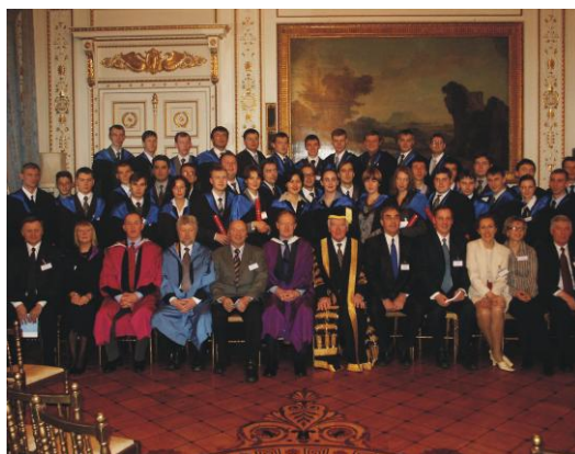
Выпускники ЦППСНД в посольстве Британии

Для студентов и преподавателей в Центре имеется своя библиотека, где собрана учебная литература по основным модулям, которые читаются во время обучения. Информация представлена на бумажных носителях, видеокассетах и компакт-дисках на русском и английском языках. Кроме этого, Центр располагает периодическими специализированными изданиями и