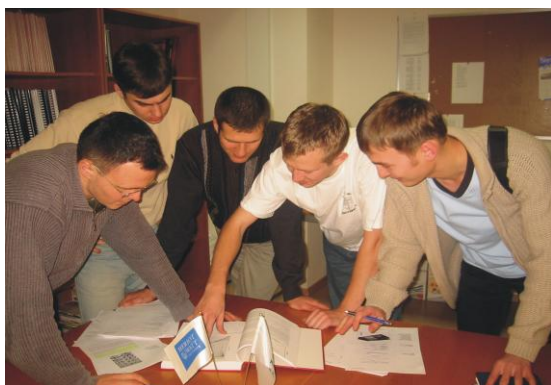
Студенты в библиотеке

нефтегазового дела. Обучение в Центре проводится на основе магистерских программ шотландского университета Heriot-Watt (Шотландия, г. Эдинбург). Центр осуществляет подготовку специалистов по трем направлениям: Нефтяной инженеринг (MSc in Petroleum Engineering), Геология нефти и газа (MSc in Reservoir Evaluation) и Технология нефти и газа (MSc in Oil and Gas Technology). Обучение в Центре проходит в течение 12 месяцев и дает слушателям интегрированные знания и навыки командной работы, что является необходимым условием для успешной карьеры в современной нефтегазовой промышленности.