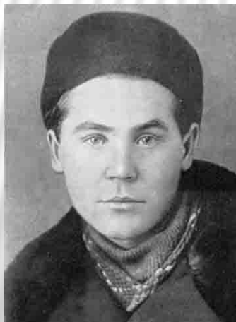
Лейтенант Н.Майоров, погибший в 1941 году.

Что гибель нам! Мы даже смерти выше, В могилах мы построились в отряд! И ждем приказа нового, И пусть не думают, что мертвые не слышат, Когда о них потомки говорят!