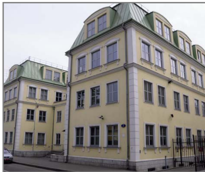
Представительство в Москве