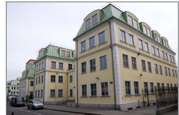
Дом немецкой экономики