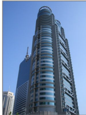
Преставительство в Шанхае