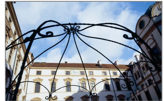
Головной офис в Целле