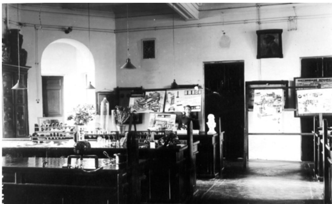
Главная лекционная аудитория кафедры, 1912г. (ныне 117ауд.)

Таким образом, кафедра технологии силикатов является одной из старейших кафедр университета, в 2002г. она отмечает свой столетний юбилей.