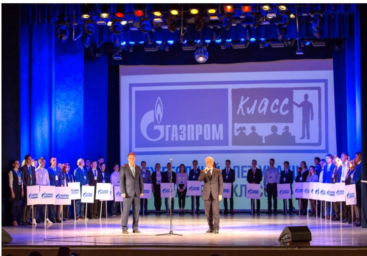
Открытие III Ежегодного слета учащихся «Газпром-классов»

С 29 октября по 2 ноября 2018 года в г. Уфе прошел III Ежегодный слет учащихся «Газпром-классов». В Слете приняли участие представители 22 городов из 5 федеральных округов Российской Федерации.