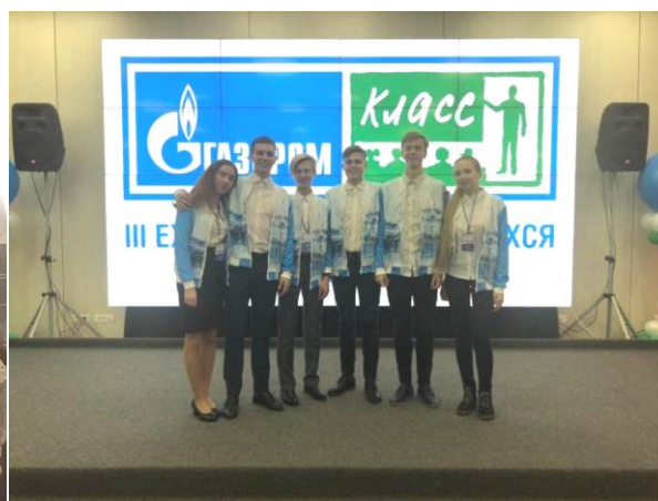
Команда МБОУ лицей при ТПУ г. Томска

Эти дни пролетели для меня незаметно. Этот «Газпром-слет» запомнится надолго каждому его участнику, ведь именно здесь мы получили бесценный опыт и завели много новых друзей!