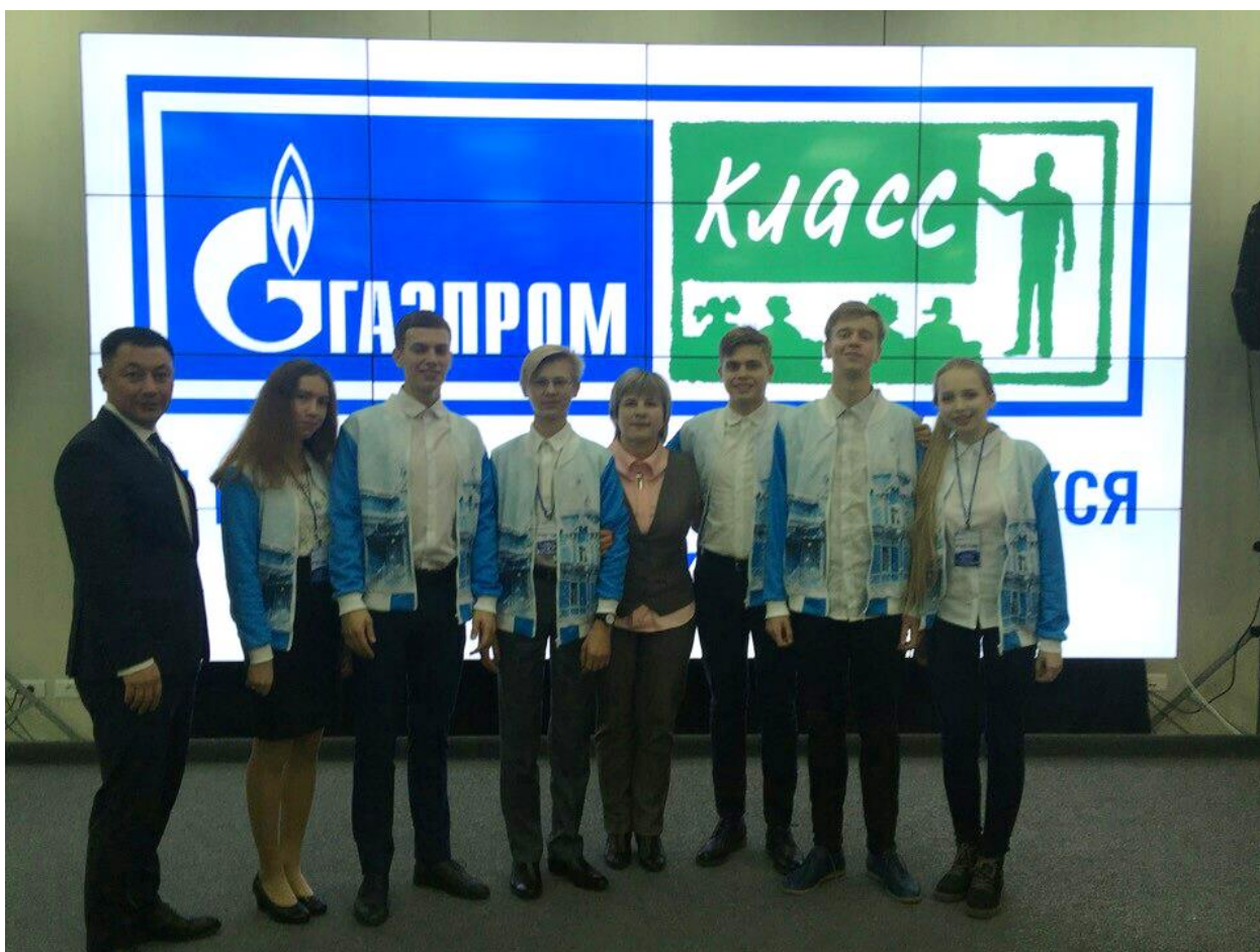
Команда МБОУ лицей при ТПУ г. Томска