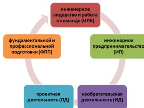
Рис. 2. Модули программы ЭТО

Стандарт 8 – Активное обучение. В рамках программы ЭТО разработан и внедрен игровой образовательный контент в дисциплины [12-14]: