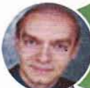
Александр Кляйн, профессор Технического университета Мюнхена (Германия), семинар "Discrete Event Simulation", 1–14 октября 2012 г., ТПУ

– приглашение иностранных профессоров для чтения лекций и проведение семинаров (2011/12 уч. год).