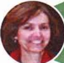
Нурия Кастел, декан школы информатики, Каталонский политехнический университет (Испания), открытые лекции, семинар, 24–27 мая 2012 г., ТПУ