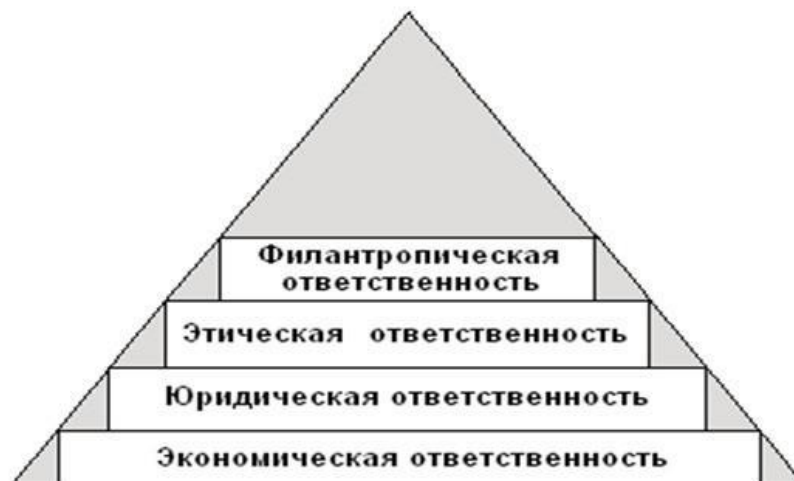
Рисунок 1. Компоненты социальной ответственности корпорации

Этическая ответственность , в свою очередь, требует от деловой практики созвучности ожиданиям общества, не оговоренным в правовых нормах, но основанным на существующих нормах морали.