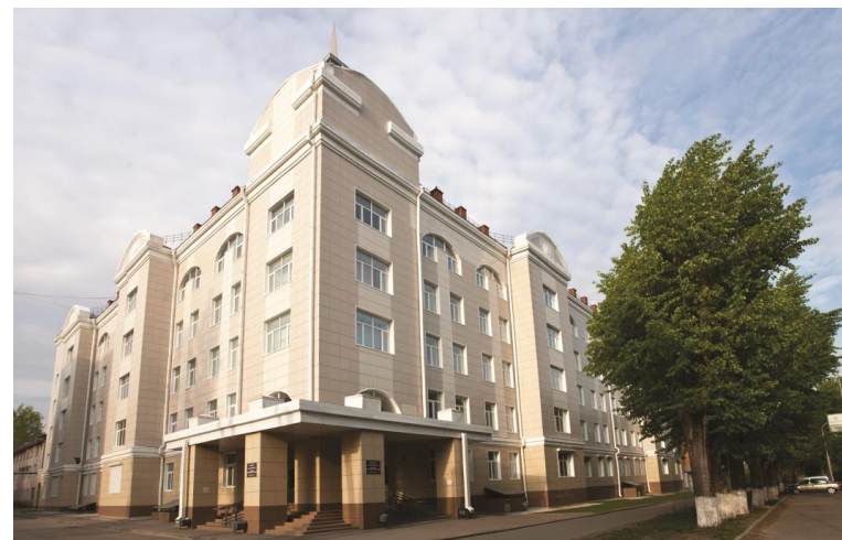
20-й корпус ИПР ТПУ