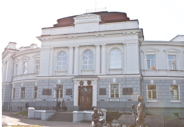
Первый корпус ИПР ТПУ

Институт природных ресурсов (ИПР) – самый крупный институт ТПУ