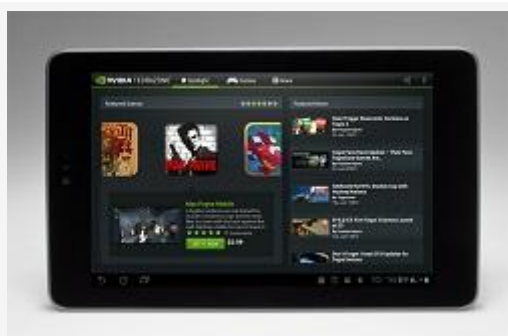
Поощрительный приз - планшет.

Внимание! Оформление визы, страховка, трансфер до Москвы иногородним победителям не входят в приз и оплачиваются победителем самостоятельно.