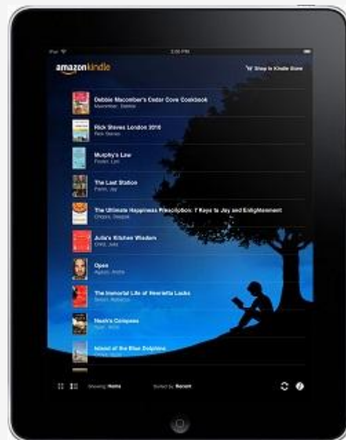
Поощрительный приз - электронная книга.

адрес: BCcompetition@ces-schools.com до 22 февраля 2014 включительно!