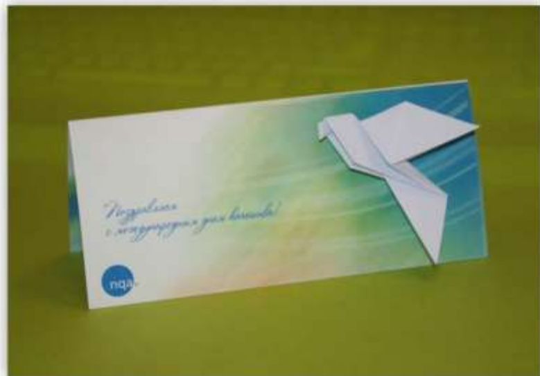
открытка к международному дню качества NQA