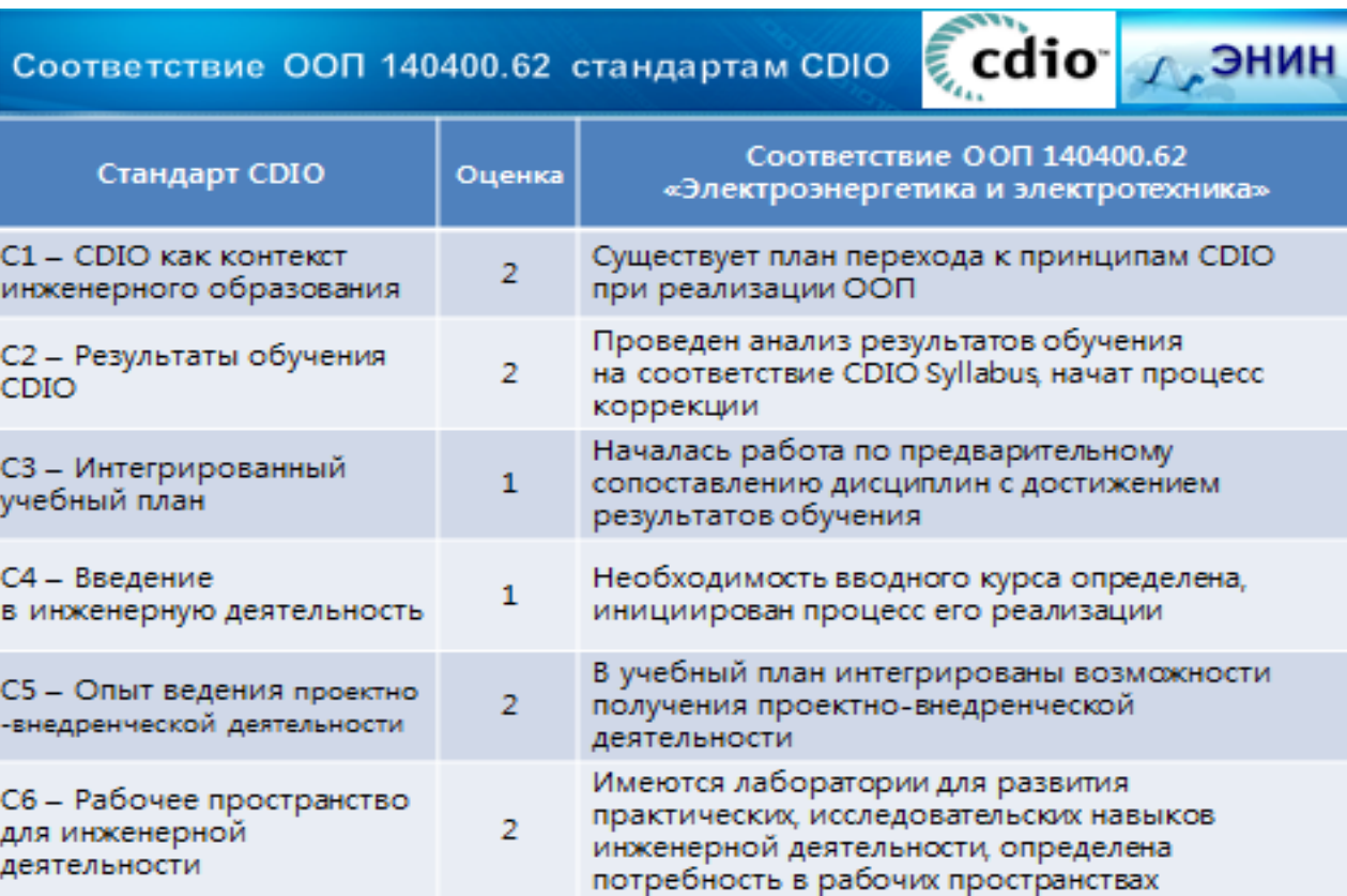
Рис.1 Соответствие ООП «Электроэнергетика и электротехника» стандартам CDIO