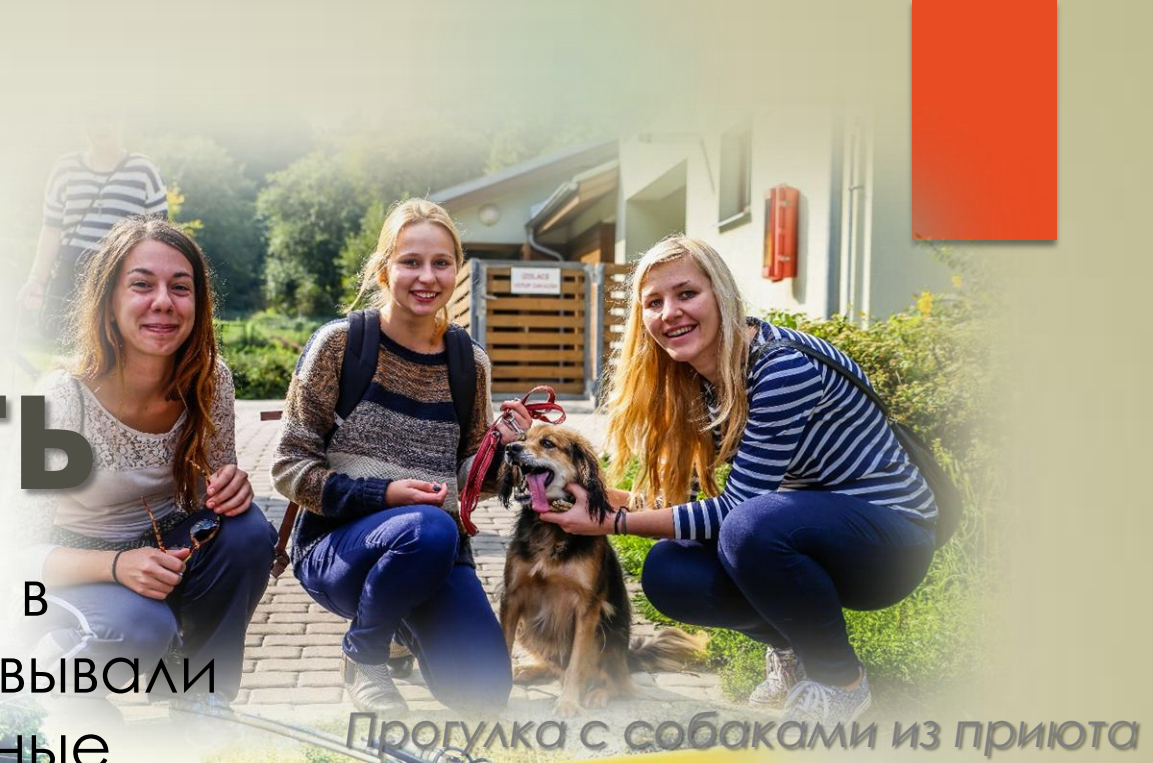
Прогулка с собаками из приюта

Чешские студенты из Buddy System в течение всего семестра организовывали для иностранных студентов различные мероприятия.