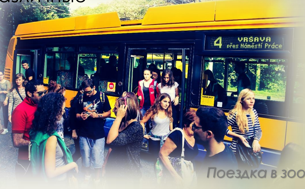
Поездка в зоопарк