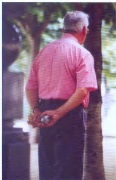
Une boule de pétanque pèse entre 650 et 800 grammes.

■ La France compte 1,2 million de piscines privées, c'est un des pays les plus équipés au monde et le premier en Europe devant l'Espagne.