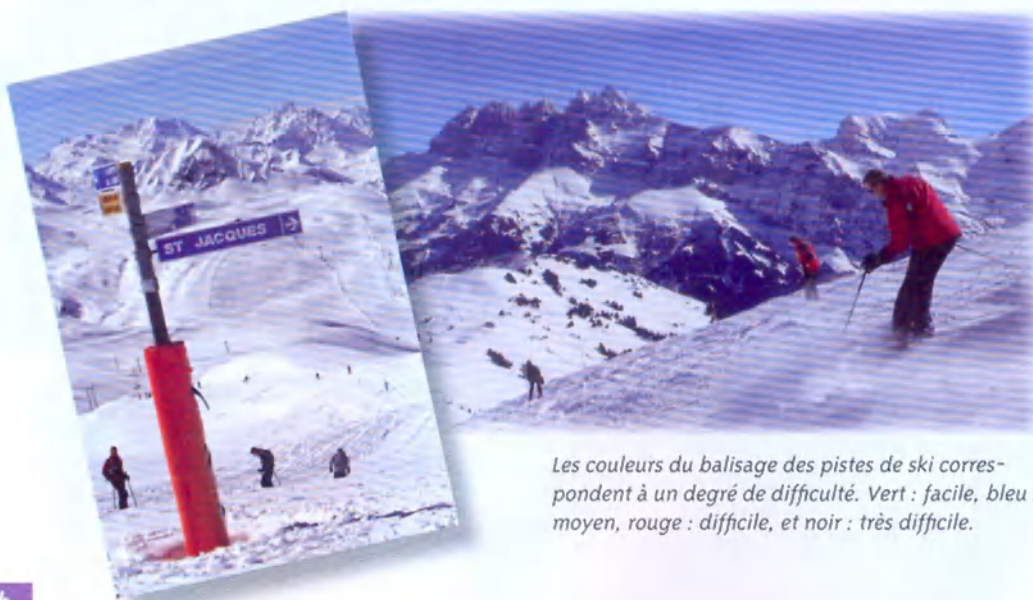
Les couleurs du balisage des pistes de ski correspondent à un degré de difficulté. Vert : facile, bleu : moyen, rouge : difficile, et noir : très difficile.

Les stations des Alpes sont les plus recherchées pour l'étendue des domaines skiables et l'altitude, mais certains délaissent les « usines à neige » au profit de stations plus modestes à l'ambiance plus familiale. On skie dans les Pyrénées, le Jura, les Vosges et même en Corse.