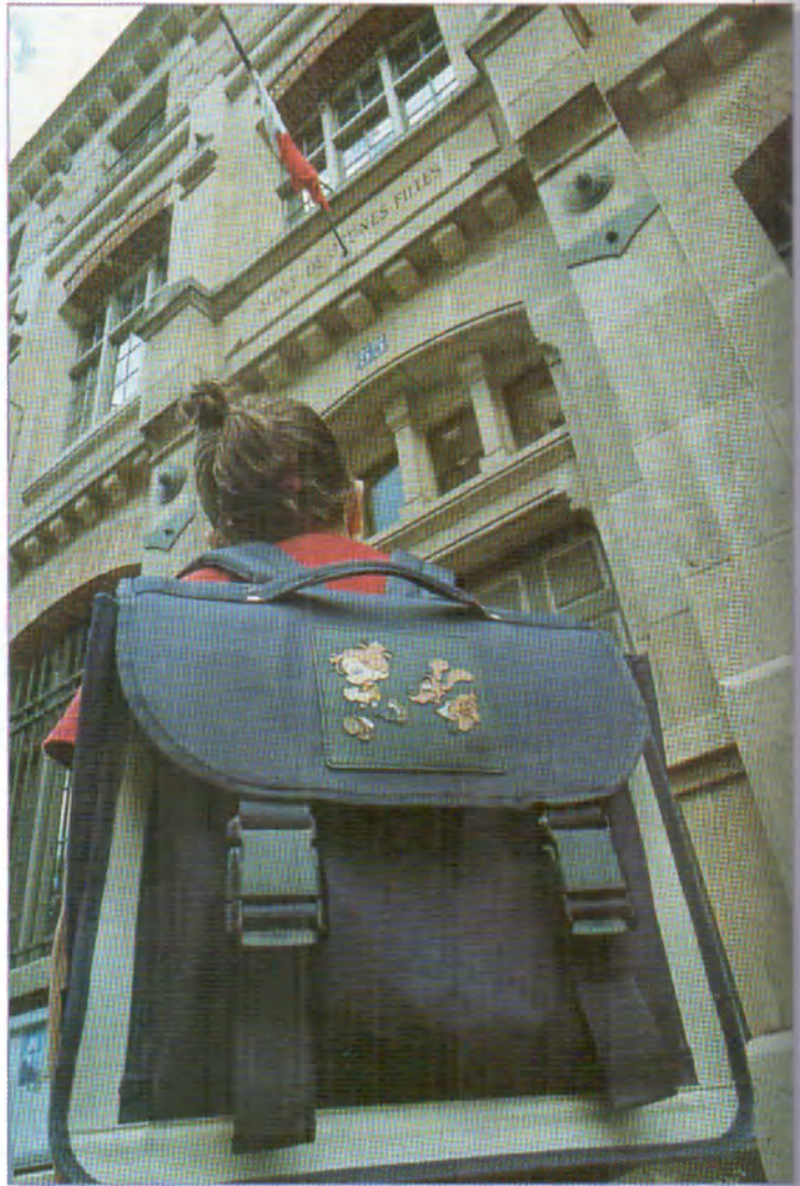
Une écolière à la porte d'entrée de son école. L'école est obligatoire jusqu'à 16 ans.

Pour les Français, l'école doit permettre d'abord de trouver un travail ; mais son rôle est aussi de donner une culture générale, de