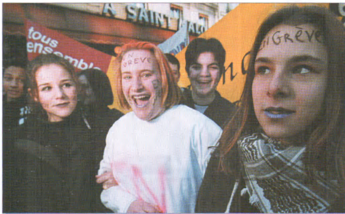
Manifestation de lycéennes et de lycéens.