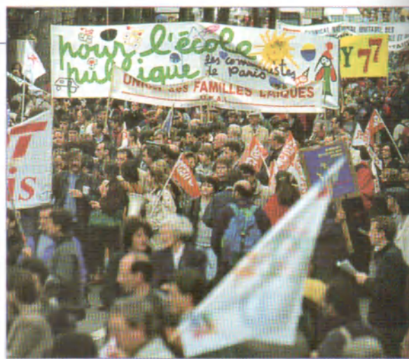
Manifestation pour l'école publique.