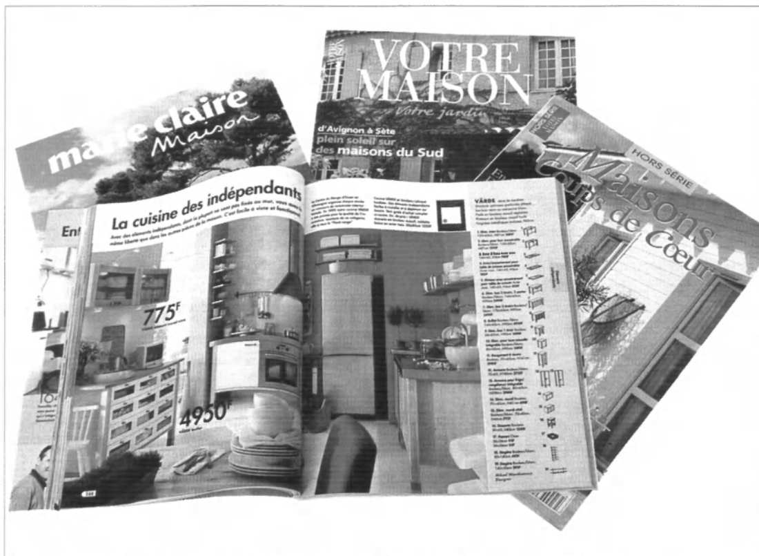
La maison est le sujet de revues spécialisées : son aménagement est la principale dépense des Français.