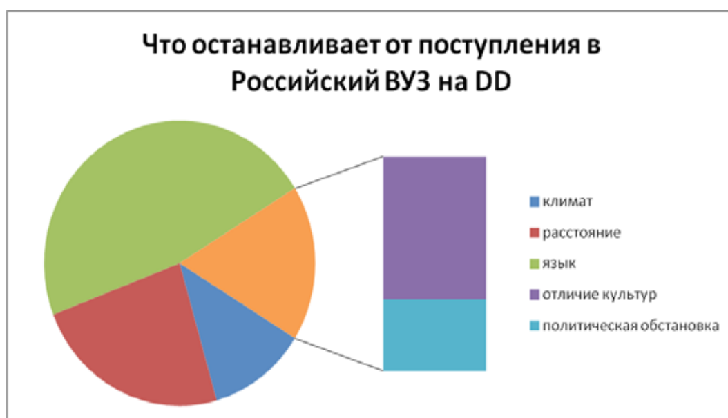
Рис. 1. Причины, препятствующие поступлению иностранцев в российский вуз

Вернемся к вопросам, поставленным в начале статьи — настолько ли важно уделять вопросу привлечения иностранных студентов такое значительное внимание с учетом «легковесности» данного показателя и действительно ли нужны российским университетам иностранные студенты. Среди основных показателей рейтинга QS наибольший вес имеет такой показатель, как репутация в академических кругах. При этом очевидным является тот факт, что репутация не может возникнуть из ниоткуда. Для её возникновения требуется взаимодействие — партнерское, научное, взаимовыгодное сотрудничество. Сама по себе студенческая мобильность без четкого понимания целей и задач, видения результатов, которые будут достигнуты сразу после участия в таких программах или в перспективе, вряд ли может стать толчком к такому взаимодействию и сформировать зачатки репутации. В таком случае можно гово-