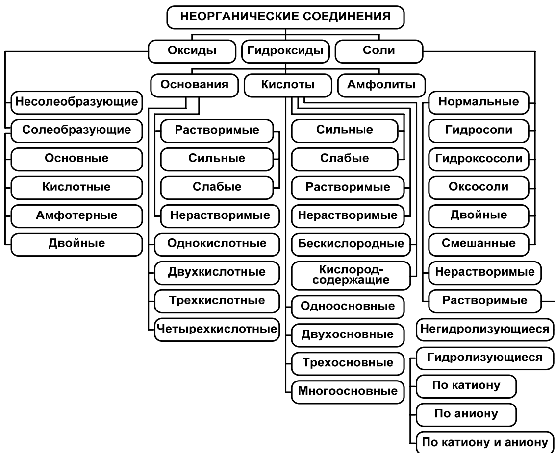
Таблица 10. НАЗВАНИЯ КИСЛОТ И СОЛЕЙ

(кроме поликислот, тиокислот и комплексных кислот; формулы несуществующих и неустойчивых кислот приведены в скобках)