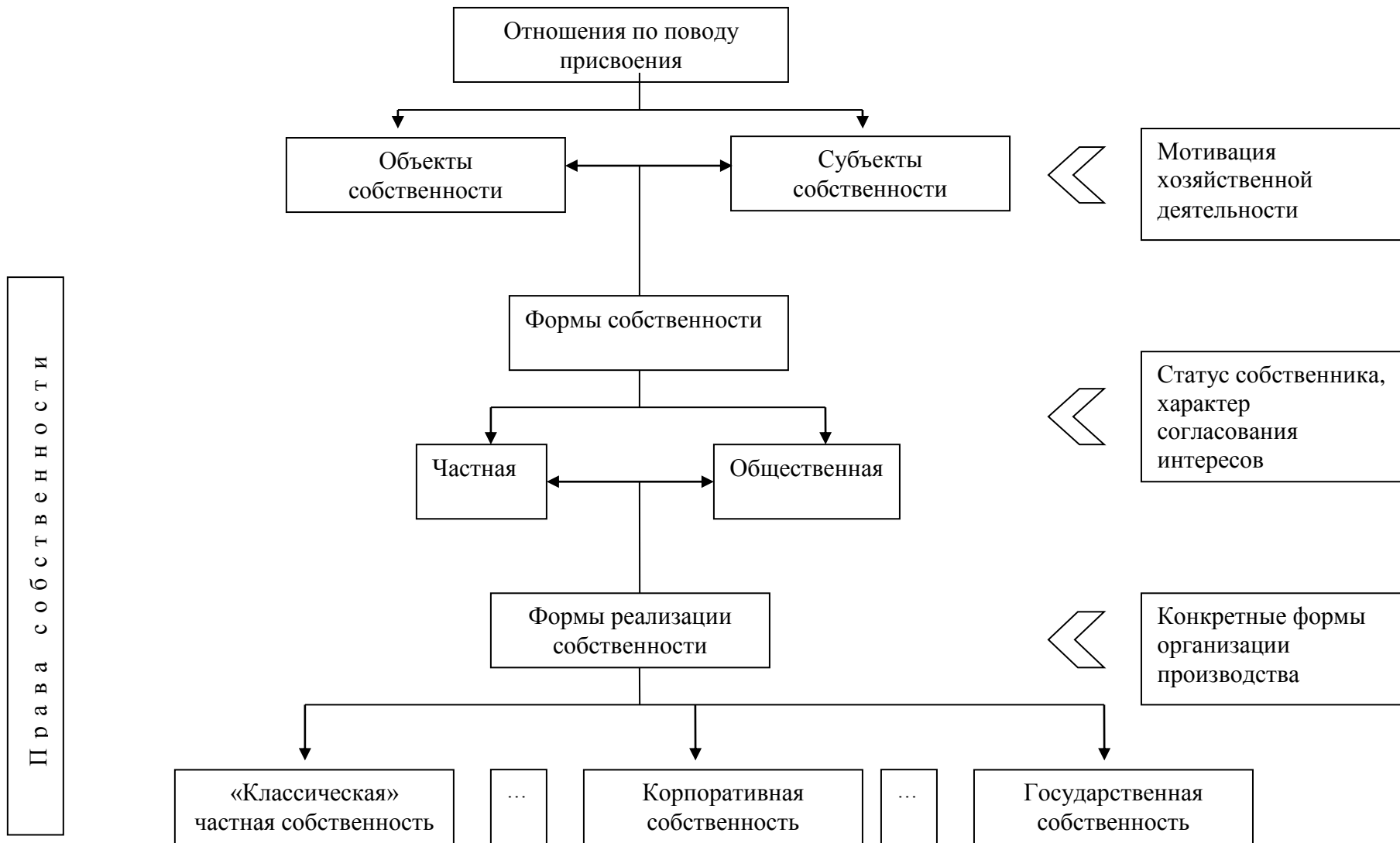
Рисунок – 1 Собственность как экономическая категория