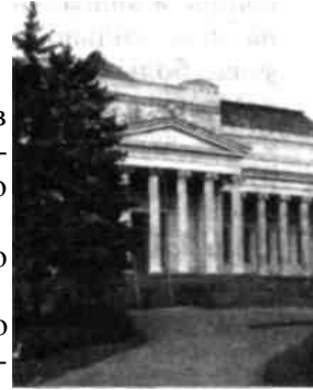
Музей изобразительных искусств имени А. С. Пушкина

Обобщите полученную информацию и сделайте выводы.