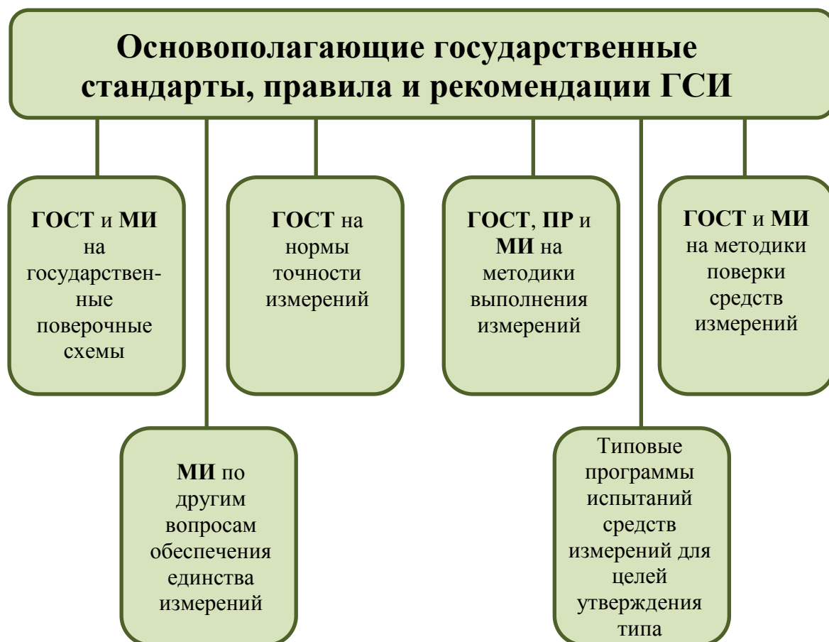
Рис.4. Нормативные и рекомендательные документы ГСИ

На рисунке 4 показан в обобщенном виде массив нормативных и рекомендательных документов ГСИ. В настоящее время в составе ГСИ около 2500 документов, утвержденных Госстандартом России и его метрологическими институтами.