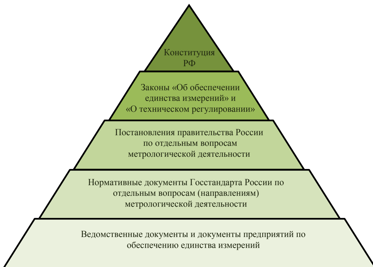
Рис.2. Нормативно-правовая база обеспечения единства измерений