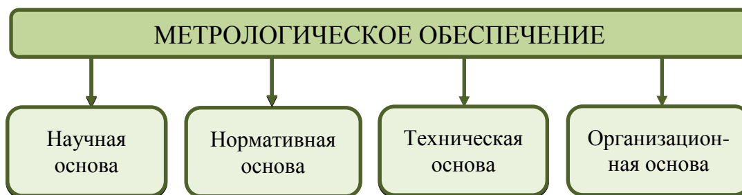
Рис.1. Структура метрологического обеспечения

Научной основой метрологического обеспечения является метрология , т.е. наука об измерениях.