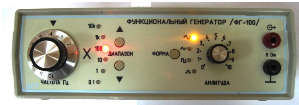
Рисунок 6.4. Генератор электрических сигналов

Для создания шума используется генератор низкочастотных сигналов. Внешний вид генератора представлен на рисунок 6.4.