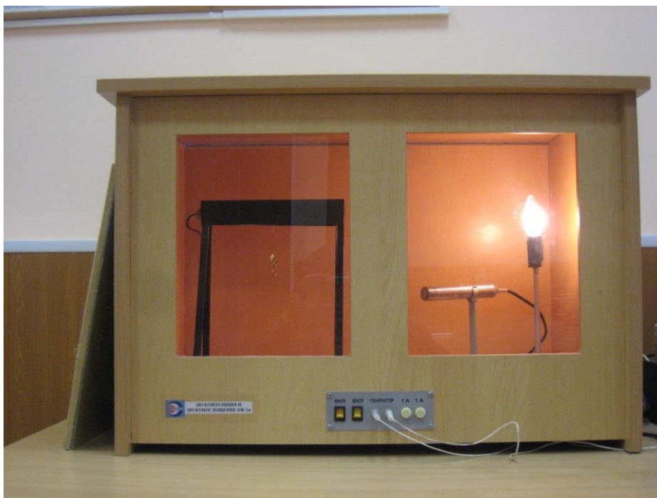
Рисунок 6.2. Лабораторный стенд

Стенд имеет вид макета производственных помещений, одно из которых имитирует производственный участок (слева), а второе – конструкторское бюро (справа).