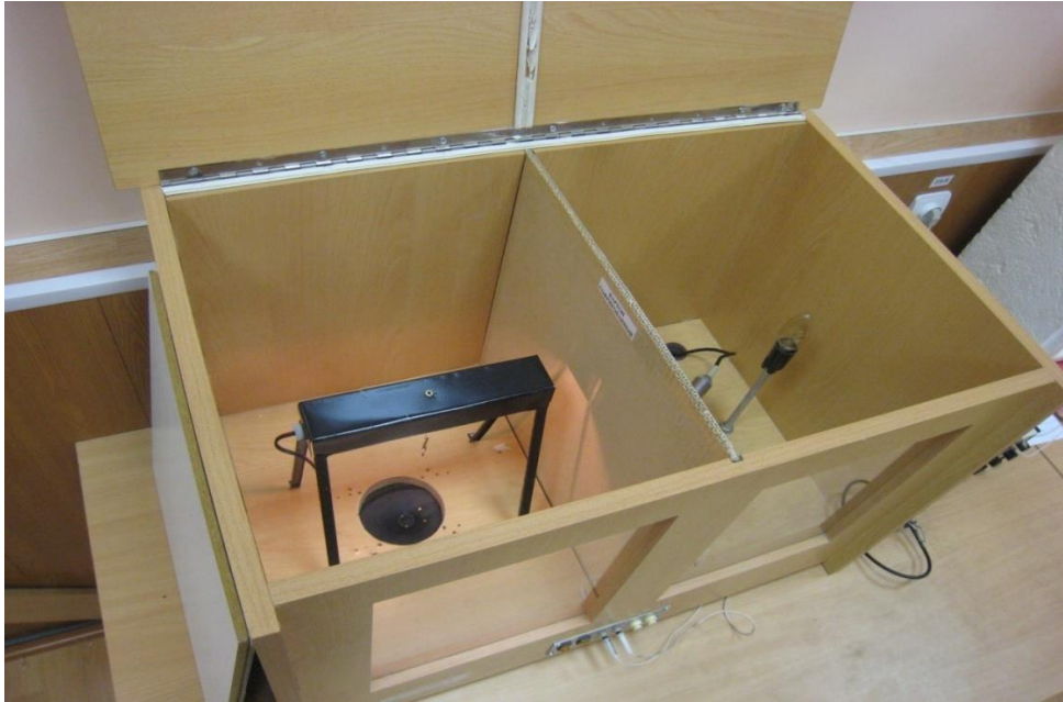
Рисунок 6.3. Внутреннее устройство стенда