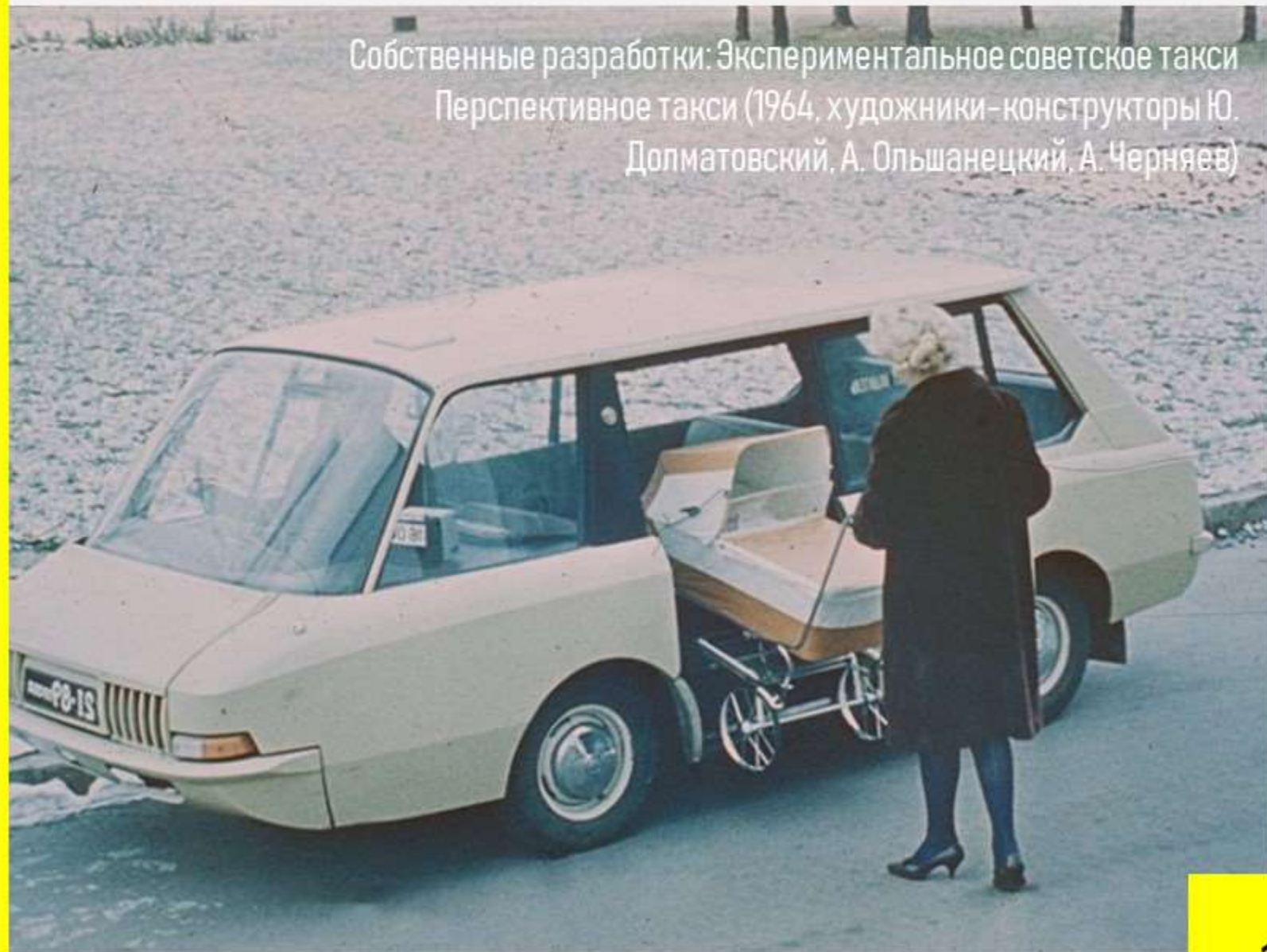
Собственные разработки: Экспериментальное советское такси Перспективное такси (1964, художники-конструкторы Ю. Долматовский, А. Ольшанецкий, А. Черняев)