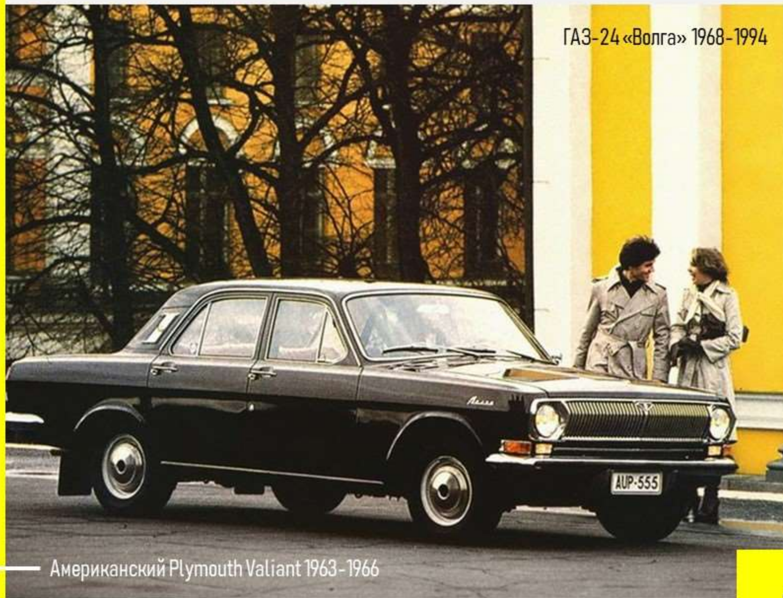
ГАЗ-24 «Волга» 1968-1994