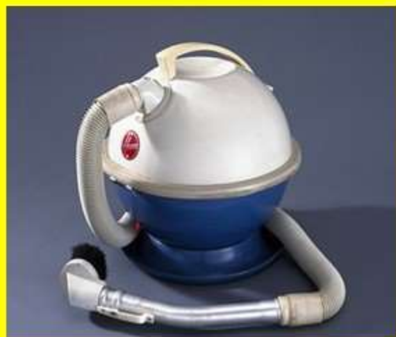
← Американский прототип HOOVER CON-STELLATION 1955