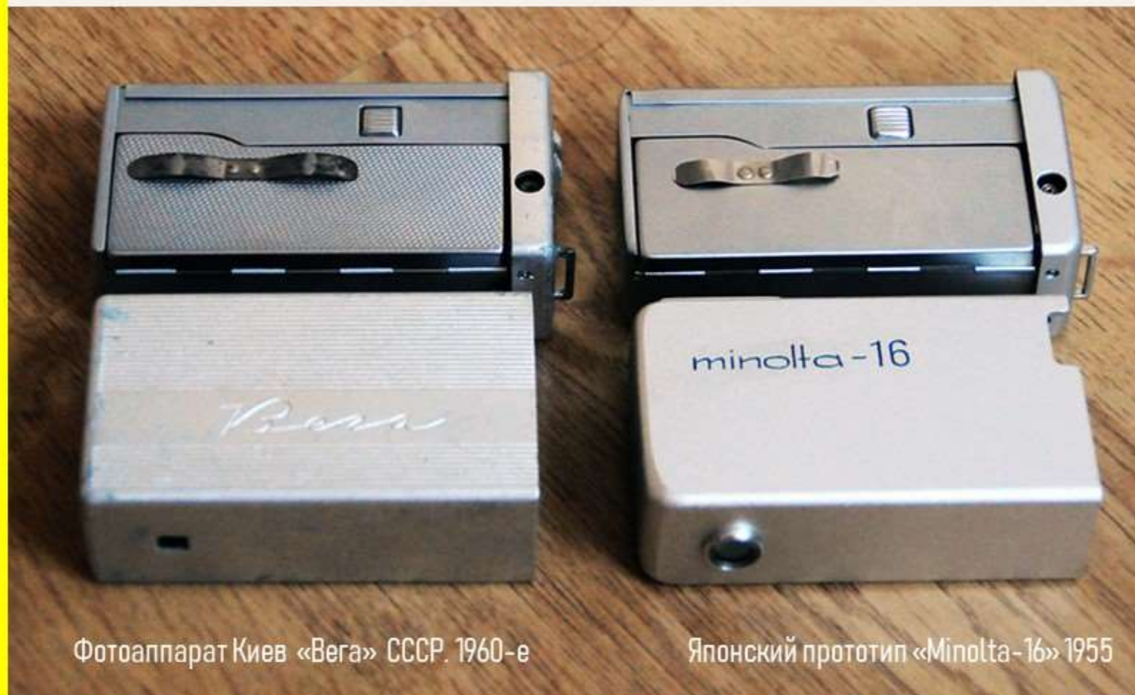
Фотоаппарат Киев «Вега» СССР. 1960-е