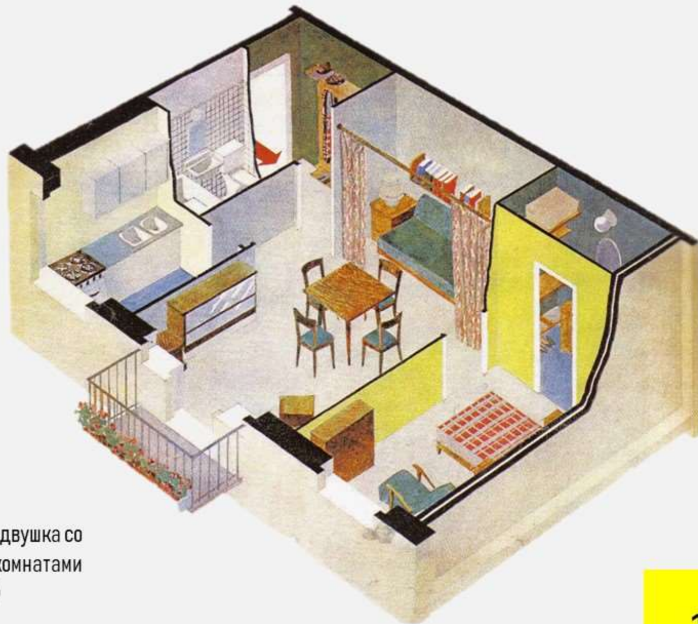
Квартира-двушка со смежными комнатами (хрущевка)