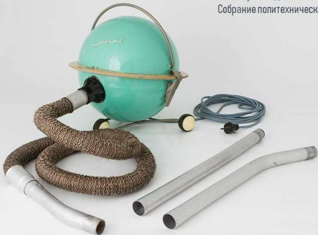
Пылесос «САТУРН». Производился с 1962 в Литве. Собрание политехнического музея.