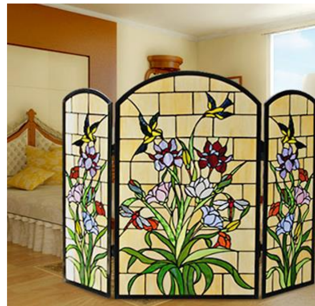
Изделия в техники Витража