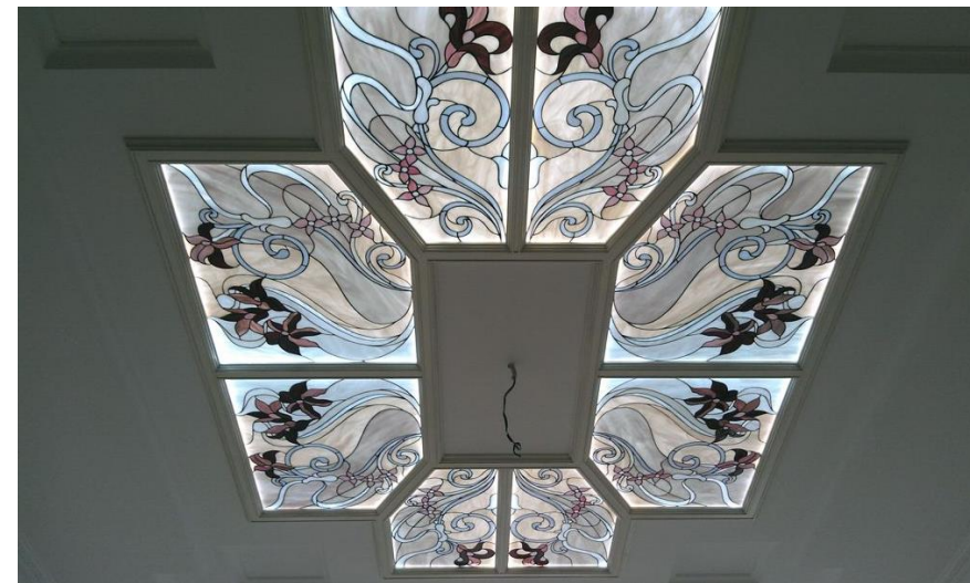
Идеи витражных потолочных конструкций