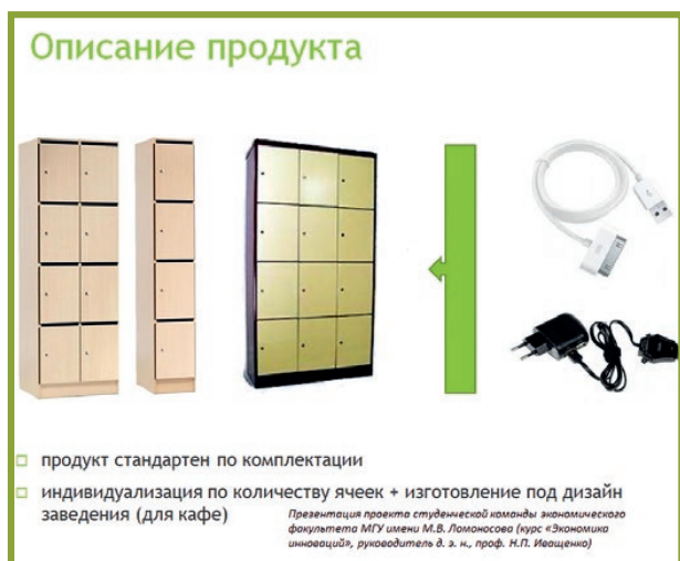
Рисунок 2. ЗАМЕНИТЕ ТЕКСТ КАРТИНКАМИ, ГДЕ ЭТО ВОЗМОЖНО 1

Поэтому информация должна быть визуально яркая, системная и образная. Для того чтобы реализовать данное условие, необходимо там, где это возможно, слова, текст заменять картинками, диаграммами и таблицами, а текст выводить в речь (см. рис. 2). Так, представляя преимущества своего продукта по сравнению с конкурентами, имеет смысл делать это в табличной форме либо сопровождать речь иллюстрациями, картинками, фото и т. д. Презентуя исследования рынка, необходимо использовать графики, диаграммы, схемы и т. п. Представляя команду, желательно использовать фото, а словесную информацию о команде структурировать графически и пространственно на слайде.