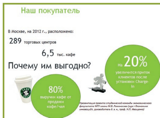
Рисунок 3. СТРУКТУРИРОВАНИЕ ИНФОРМАЦИИ НА СЛАЙДЕ 2