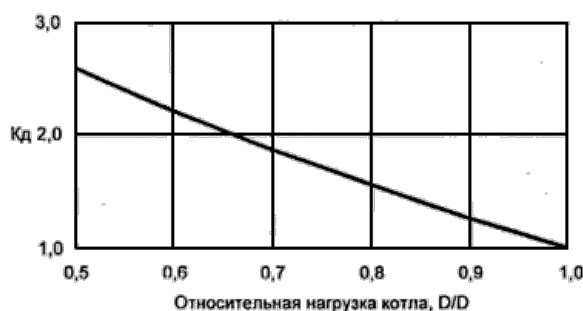
Рисунок E1 - Зависимость K_d от относительной нагрузки котла