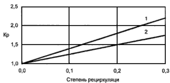
Рисунок E2 - Зависимость K_p от степени рециркуляции

1 - в дугевогой воздух или кольцевой канал вокруг горелок 2 - в щлицы под горелками