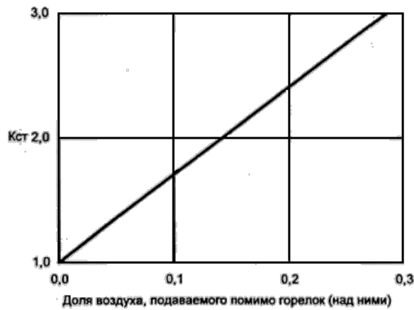
Рисунок Е3 - Зависимость K_{ст} от доли воздуха, подаваемого помимо горелок