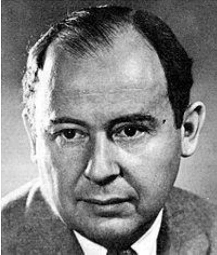
Рисунок 2.1 - Фотография Джона фон Неймана

Джон фон Нейман (англ. John von Neumann ; или Иоганн фон Нейман, нем. Johann von Neumann ; при рождении Янош Лайош Нейман, венг. Neumann János Lajos ; 28 декабря 1903, Будапешт — 8 февраля 1957, Вашингтон) — венгро-американский математик, сделавший важный вклад в квантовую физику, квантовую логику, функциональный анализ, теорию множеств, информатику, экономику и другие отрасли науки.