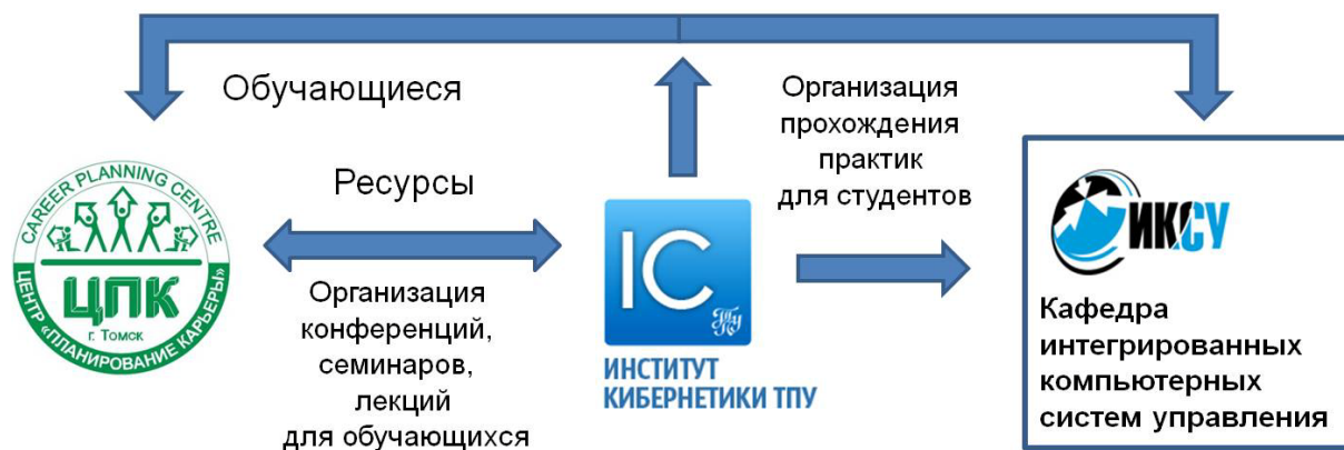
Рис. 2. Взаимодействие в рамках профориентационной программы для старшеклассников «Мехатроника и робототехника»

Педагогические кадры, для осуществления профориентационной деятельности