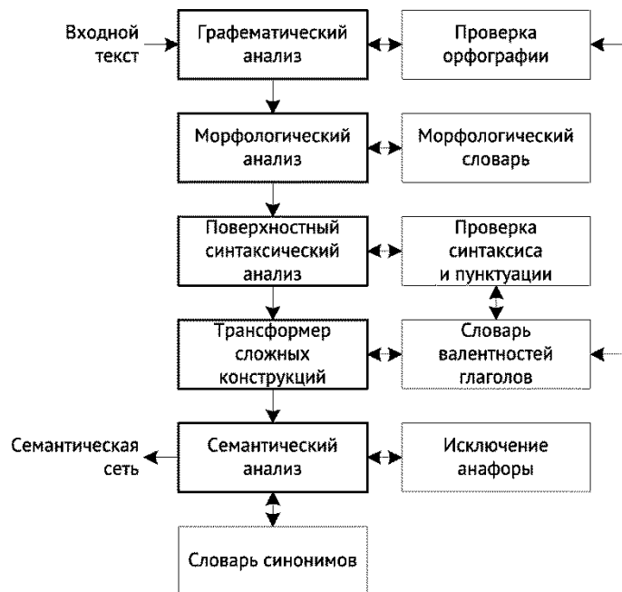
Рис. 1. Концептуальная схема лингвистического процессора

Конечной целью обработки текстовой информации лекционного материала и ответа обучаемого является оценка правильности ответа обучаемого на русском языке на поставленные интеллектуальной системой вопросы. Правильность и глубина ответа определяются системой путем вычисления степени семантической близости ответов обучаемых к лекционным материалам, являющихся эталоном. В случае частичного раскрытия темы в ответе на сформулированный системой вопрос по конкретному разделу лекционного материала, система автоматически генерирует дополнительные вопросы по данному