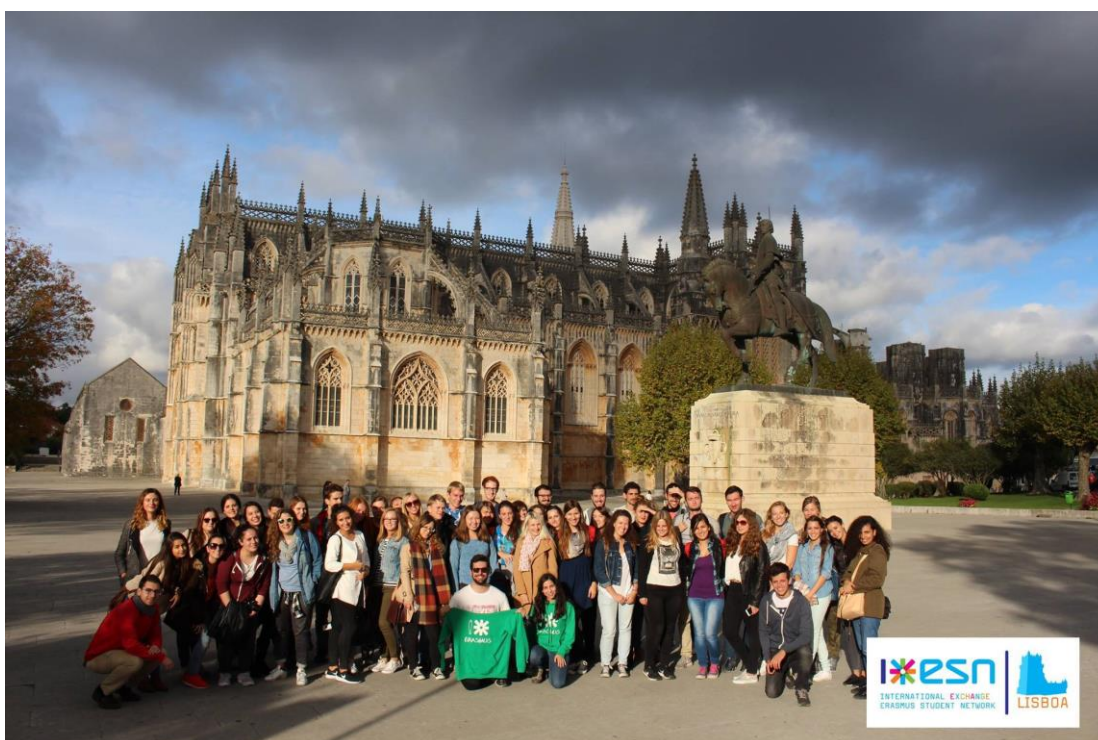
Рисунок 2 – Экскурсионная поездка от ESN

Также мы участвовали в поездках в города Порту, Севилья, Фатима, Алкобаса и Баталья, и я в восторге от каждой поездки! В Порту и Севилью мы ездили на 3 дня. Путевки стоили не очень дорого, в районе 100 евро, и в стоимость входили проезд, экскурсии, проживание, завтрак и ужин. В этих поездках участвовало огромное количество людей, поэтому это был также хороший шанс не только повеселиться и посмотреть города, но и познакомиться со многими Erasmus-студентами. В Фатиму, Алкобасу и Баталью была однодневная поездка, где нам показали местные монастыри с красивой архитектурой, которые являются достопримечательностью Португалии (рис. 2).