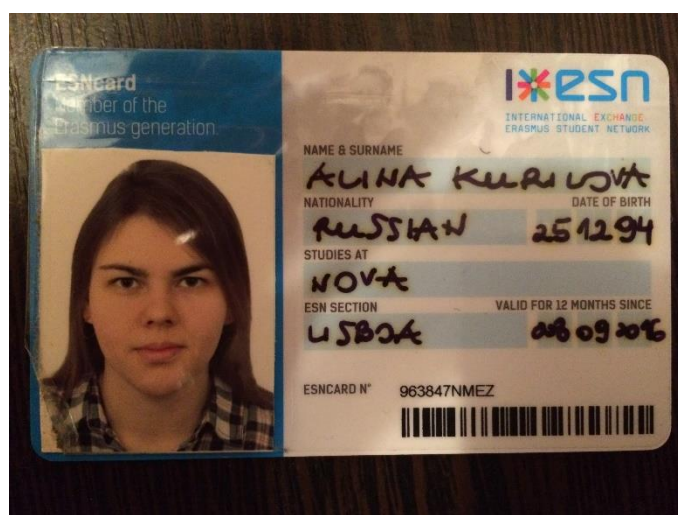
Рисунок 4 – ESN

Поэтому рекомендую из внеучебных мероприятий участвовать в тех, которые проводятся организациями, созданными для Erasmus-студентов, такими как «Erasmus Student Network» и «Erasmus Life Lisboa». Но поскольку таких мероприятий очень много, то не обязательно ходить на все, а лишь на те, которые интересны.