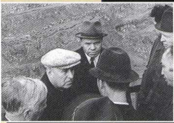
Министр из Книги рекордов Гиннеса

Metal Bulletin СПЕЦИАЛЬНО ДЛЯ РОССИИ И СНГ