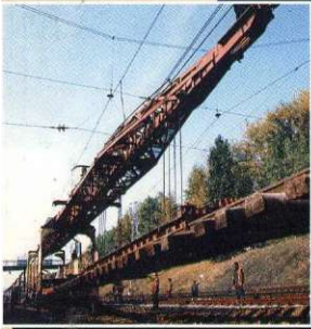
Великий путь севернее Транссиба